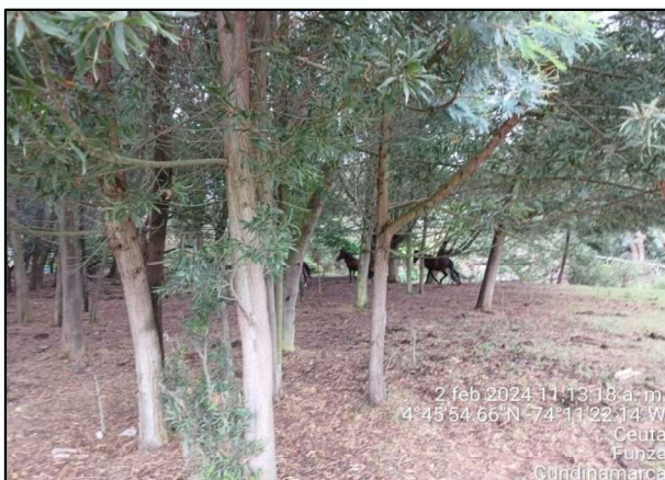
Ilustración 4. Semovientes en ronda de humedal

anteriormente, en las coordenadas 4°45'54.468" N y 74°11'22.08 W, la presencia de cuatro (4) semovientes y excremento de los mismos.