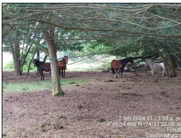
Ilustración 5. Excremento de semovientes en ronda de humedal