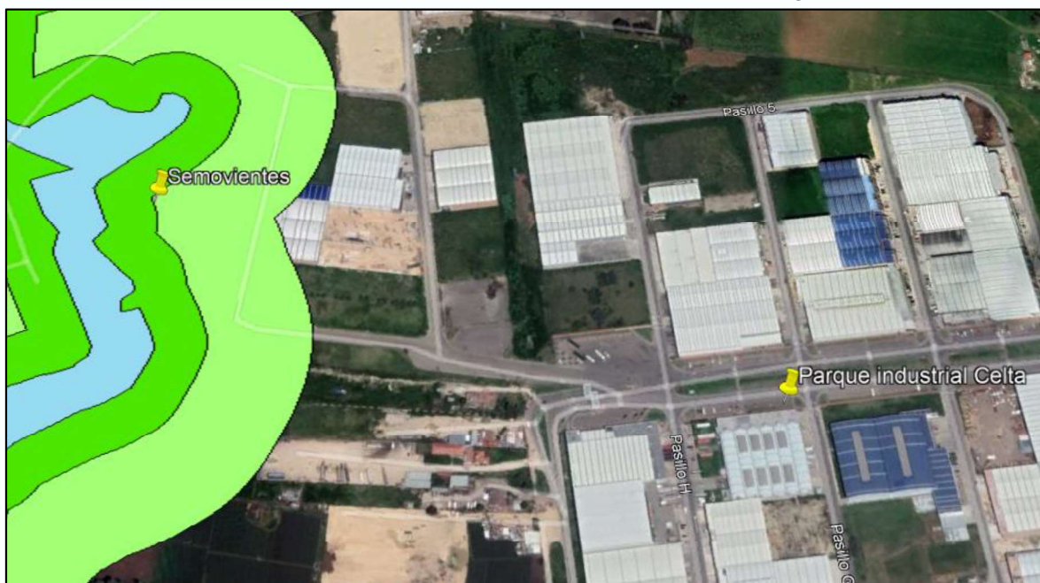
Ilustración 1. Identificación semovientes en el DMI Humedal Gualí